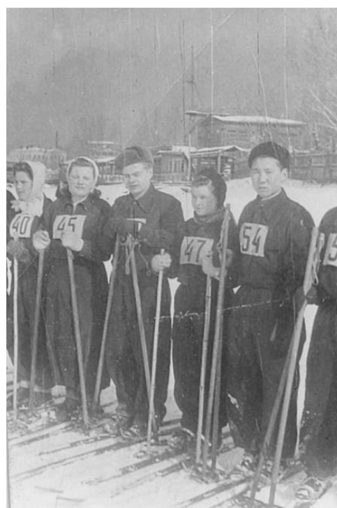
Участники лыжного перехода Бохан – Улан – Удэ.